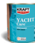
Βερνίκι θαλάσσης με φίλτρα UV