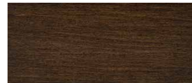
214 Καρυδιά Σκούρα