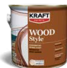
Διακοσμητικό βερνίκι κρούστας ξύλου πολυουρεθάνης