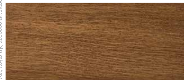
204 Καρυδιά Ανοιχτή