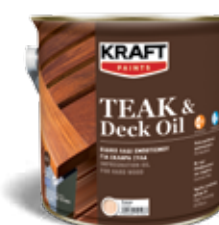
Ειδικό λάδι εμποτισμού ξύλινων επιφανειών