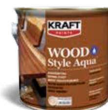
Διακοσμητικό βερνίκι ξύλου νερού πολυουρεθάνης