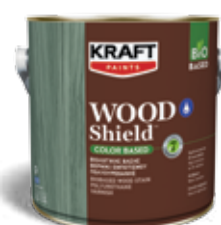
Βιολογικής βάσης βερνίκι εμποτισμού πολυουρεθάνης