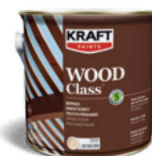
Διακοσμητικό βερνίκι εμποτισμού πολυουρεθάνης