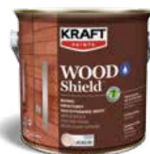
Βερνίκι εμποτισμού πολυουρεθάνης νερού