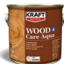
Συντηρητικό ξύλου νερού