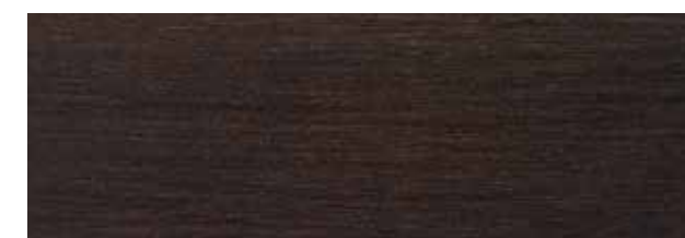
118 Καρυδιά Σκούρα